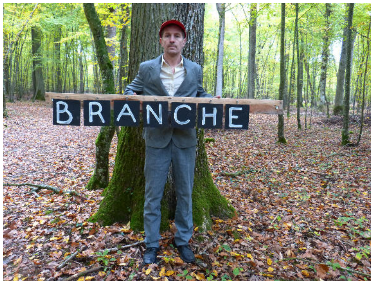
Une forêt en bois...construire, cie La Mâchoire 36