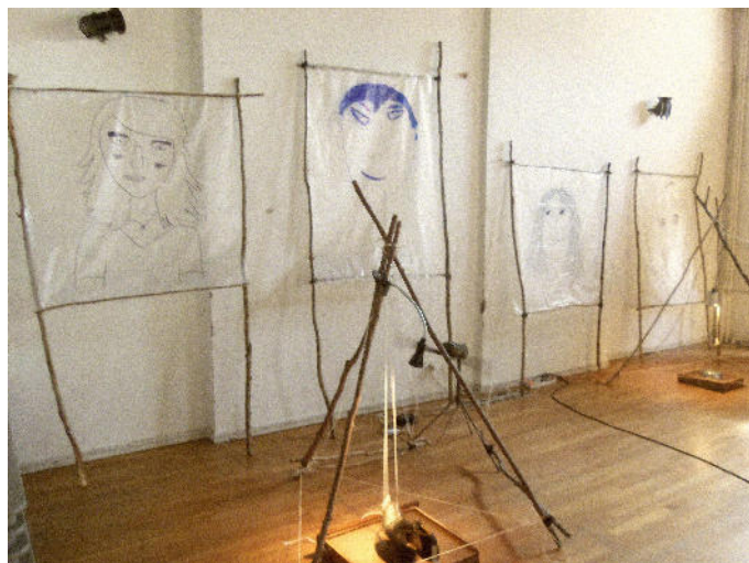
Atelier avec une classe musique du collège de La Craffe en 2012/2013. La Mâchoire 36

Par ailleurs, les élèves de l'école proposeront un ciné concert le 2 juillet également sur un western projeté en plein air dans le quartier.