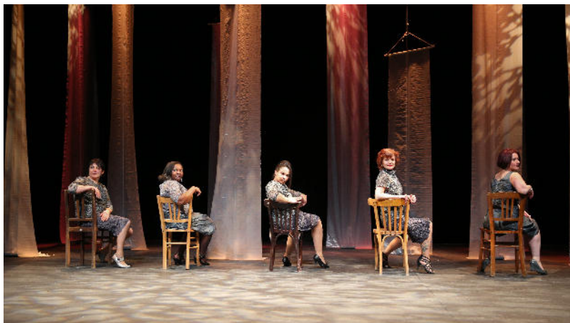
Défilé de mode 2014 du TGP mise en scène Estelle Charles, assistantat à la mise en scène Sibel Kilerciyan