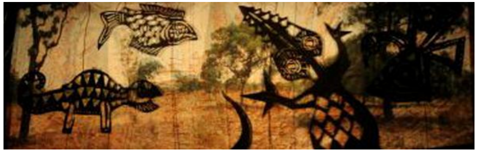
PEUT ETRE UN DRAGON CHEZ LES DOGONS... FICHE TECHNIQUE